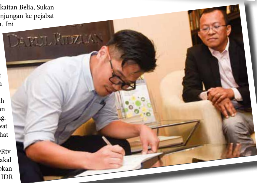
YB menurunkan tandatangan buku pelawat IDR

Beliau juga sempat ditemuramah oleh kru IDRTv sebagai sebahagian daripada video eksklusif yang bakal dipaparkan. Sebelum beredar, Howard mengucapkan terima kasih dan bercadang untuk datang lagi ke IDR dalam masa terdekat. ■