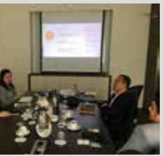
KL KEPONG SOKONG INISIATIF DIALOG PANGKOR