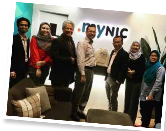
Wakil-wakil IDR bergambar bersama warga kerja MYNIC Berhad (MYNIC)

Mines Waterfront Business Park, Seri Kembangan 8 Mei 2018